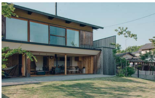
室内から芝生へと段差なくなだらかに繋がる